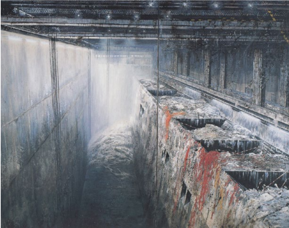
Poubelle, 1991/92, Öl auf Leinwand, 280 x 360 cm • Dauerleihgabe der RWE AG für das Kunstmuseum Gelsenkirchen

thomas punzmann contemporary, art@punzmann-contemp.com