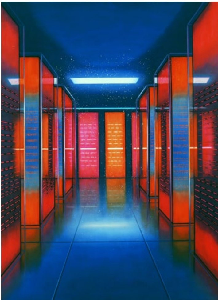
Synapse III, 2020, Öl auf Leinwand, 190 x 140 cm

thomas punzmann contemporary, art@punzmann-contemp.com