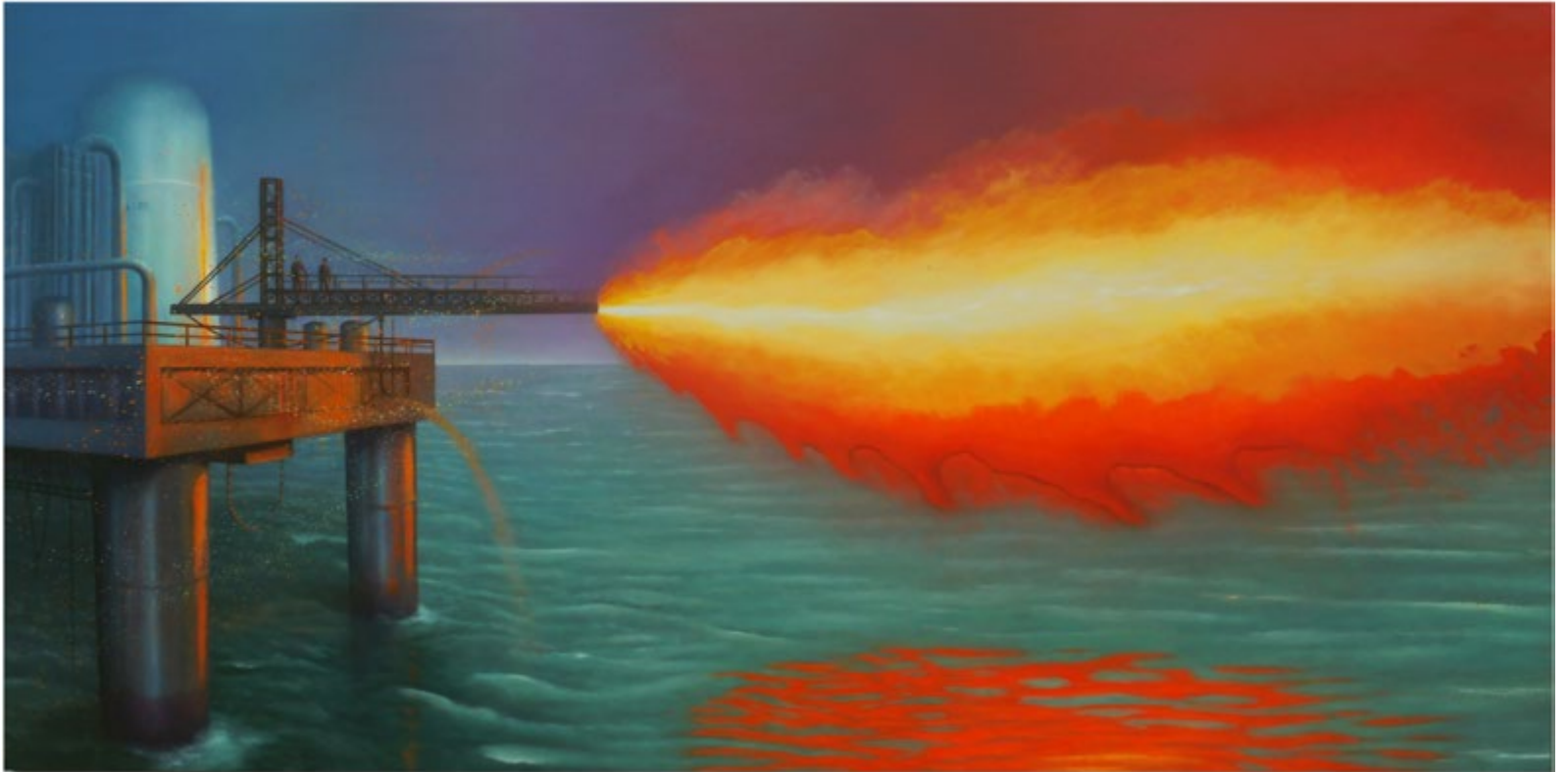
Peak Oil, 2018/19, Öl und Leuchtpigment auf Leinwand, 140 x 280 cm

thomas punzmann contemporary, art@punzmann-contemp.com