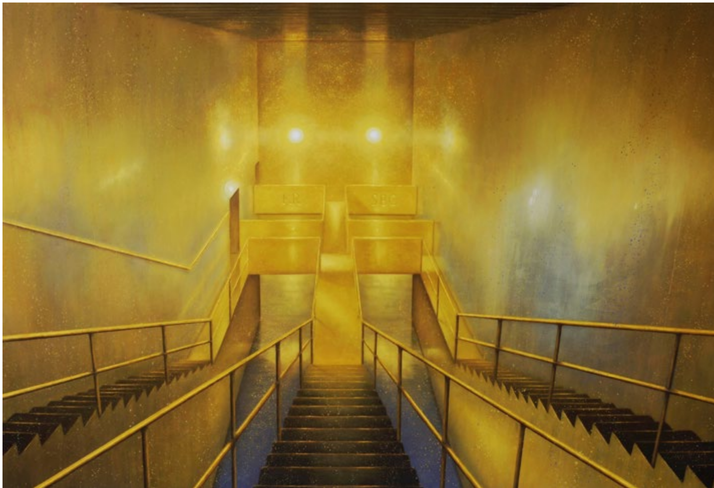
Standard Buried Collector, 2017, Öl auf Leinwand, 190 x 280 cm

thomas punzmann contemporary, art@punzmann-contemp.com