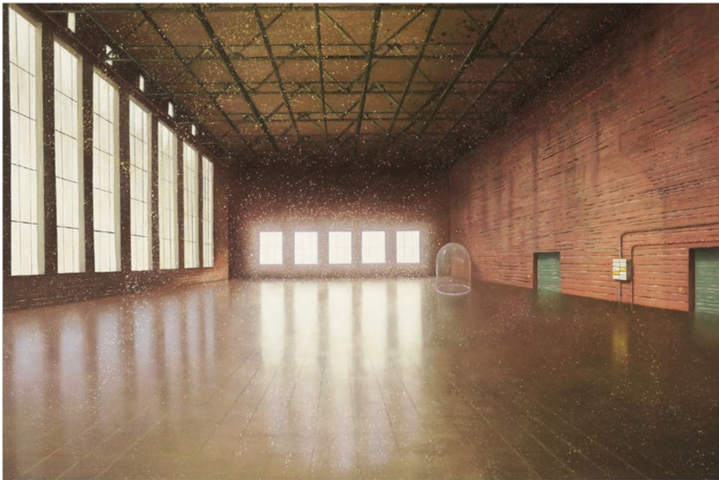
Fortissimo, 2016, Öl auf Leinwand, 190 x 280 cm • Sammlung Historisch-Technisches Museum Peenemünde