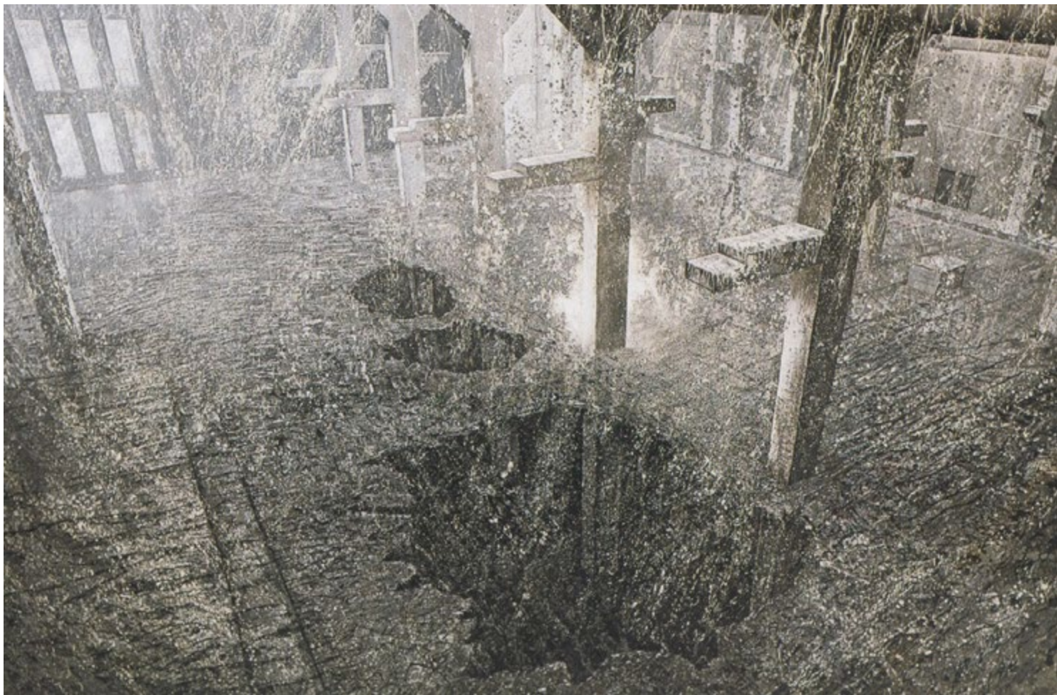
Der Durchbruch, 1992, Öl auf Leinwand, 188 x 280 cm • Sammlung LWL Industriemuseum Dortmund