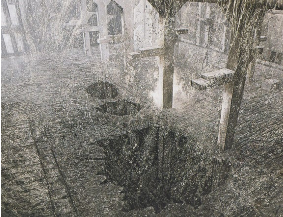
Der Durchbruch, 1992, Öl auf Leinwand, 180 x 280 cm, V2-Treibstoffproduktionshalle, Bad Lauterberg/ Harz (LWL Industriemuseum Dortmund)