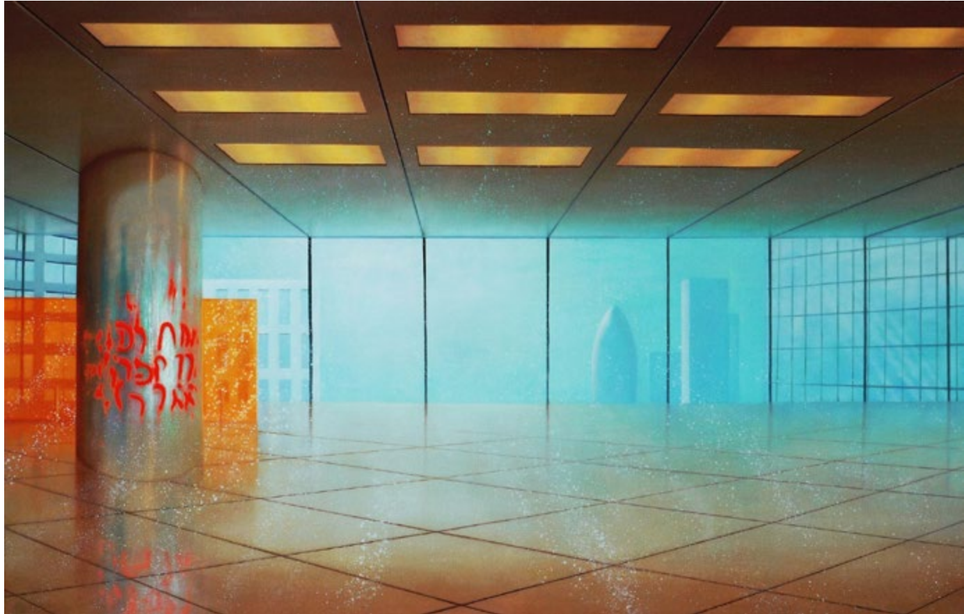
The big bubble, 2019, Öl und Leuchtpigment auf Leinwand, 190 x 280 cm