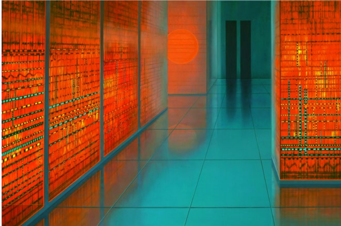
Synapse II, 2020, Öl auf Leinwand, 190 x 280 cm