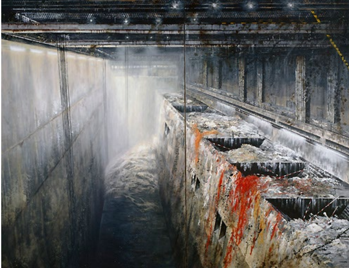
La Poubelle, 1992, Öl auf Leinwand, 280 x 360 cm, (Museum Gelsenkirchen/Dauerleihgabe der RWE AG)