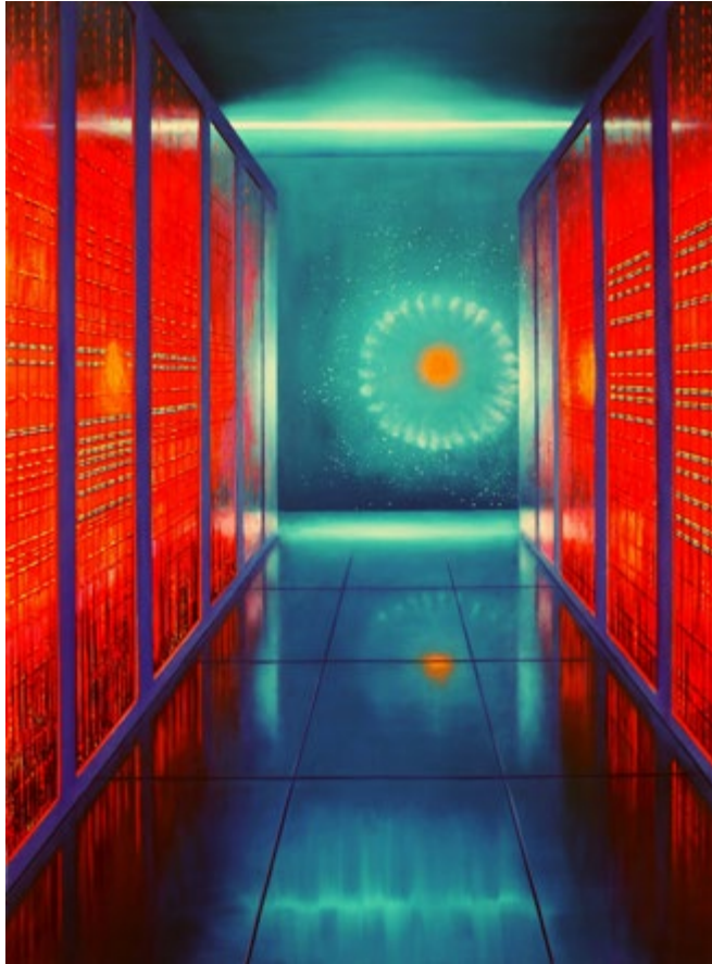
Synapse I, 2019, Öl auf Leinwand, 190 x 140 cm